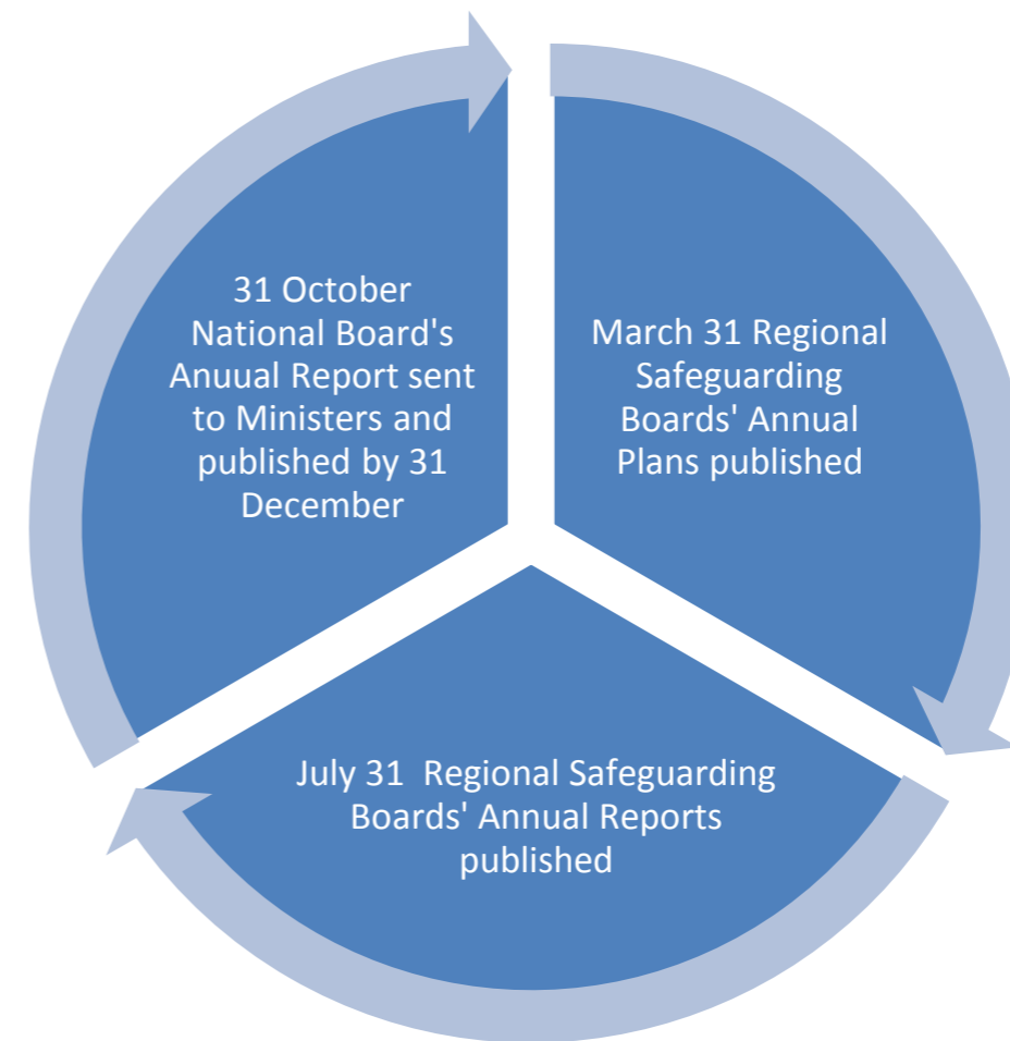
Ffigur 1: Y cylch cynllunio ac adrodd

Mae'r ffigur yn dangos cyd-ddibyniaeth amryw elfennau'r cylch cynllunio ac adrodd. Mae amserlen y Ddeddf yn sefydlu rhythm a threfn flynyddol ar gyfer y Bwrdd Cenedlaethol a'r Byrddau Diogelu Rhanbarthol.